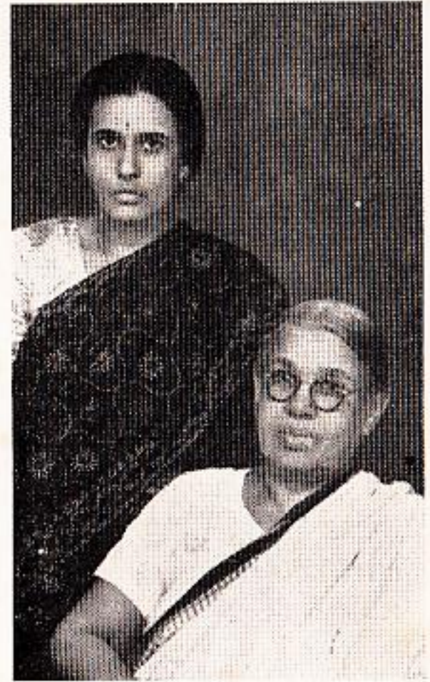
प्रभा आणि ताराबाई : हे रूप...